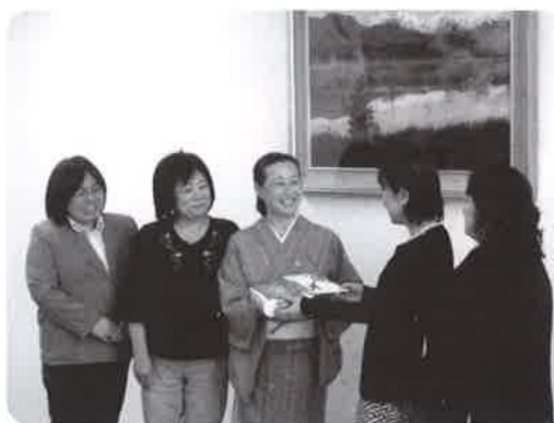
白ゆり会への贈呈式

白ゆり会は、福祉増進や子供の育成に努め相互の親睦を図ると共に、お母さんが子供たちと楽しく生き生きと過ごせる環境作りを目的とした福祉団体となります。 女性会として今後も社会貢献事業に繋がる活動を継続事業として努めて参ります。