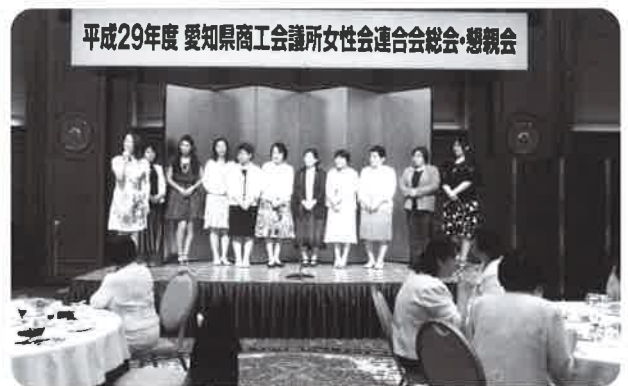
女性会アピールタイム

専務理事、女性会会長の挨拶があり、続いて尾張地区商工会議所(瀬戸・春日井・小牧・江南・犬山・一宮・稲沢・津島)8商工会議所41名にて、各女性会の組織概要や、事業計画・