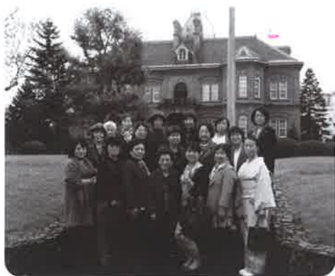
赤れんが庁舎前にて

今後活動をしていく上で、同じ志を持った仲間と力を合わせ、春日井商工会議所女性会活動を通じ地域発展に貢献していきます。