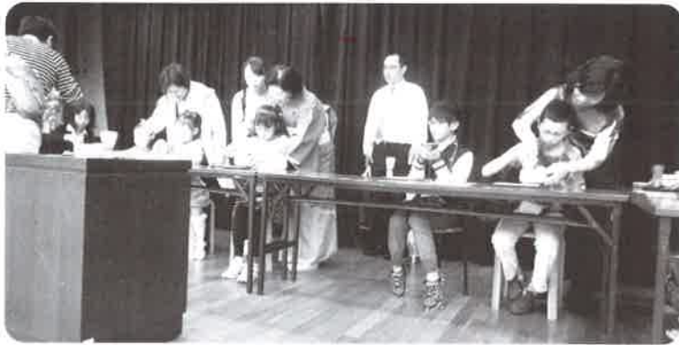
子供お抹茶体験教室

また今年度は、会議所創立50周年事業として『子供お抹茶体験教室』を実施いたしました。こちらも大好評で子供さんたちは、なかなかお抹茶に触れる機会が少ないと思いますので、お抹茶を点てる体験を通して日本のおもてなしに興味を持っていただければ大成功です。来年も可能であれば、実施していただけたらいいと思います。